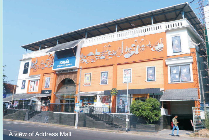
A view of Address Mall